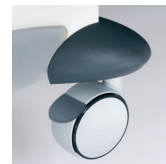
Колесо с тормозом

Zimmer MedizinSysteme GmbH Junkersstraße 9 89231 Neu-Ulm, Germany Tel. +49 (0)7 31. 97 61-291 Fax +49 (0)7 31. 97 61-299 export@zimmer.de www.zimmer.de